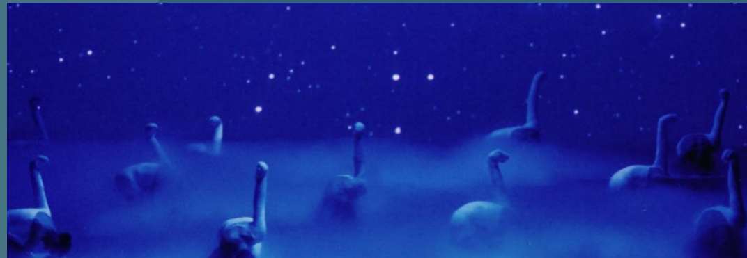
Ouverture du 2ème acte

Soliste au BCPI, elle affirme une solide technique classique. Après Sérénade, la Bayadère, le Corsaire... elle nous révèle sa sensibilité dans le cygne blanc et son charisme dans le cygne noir.