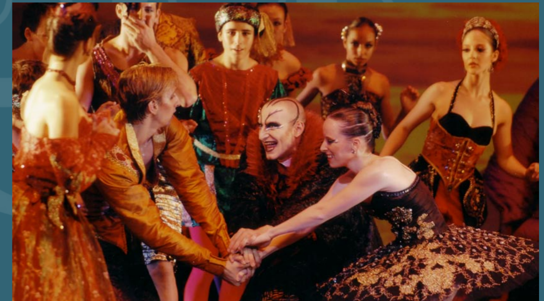
3 ème acte