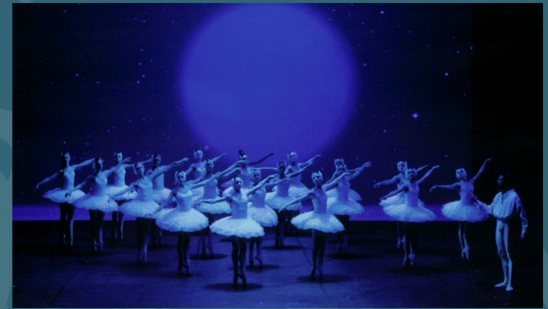
2 ème acte