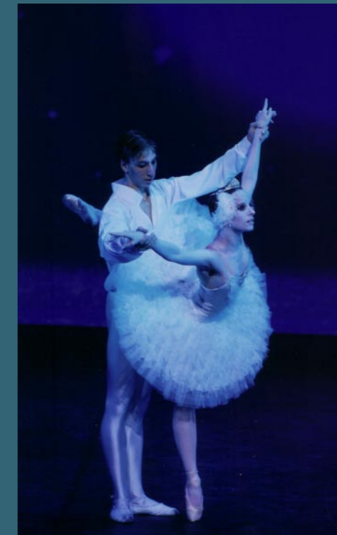
2 ème acte